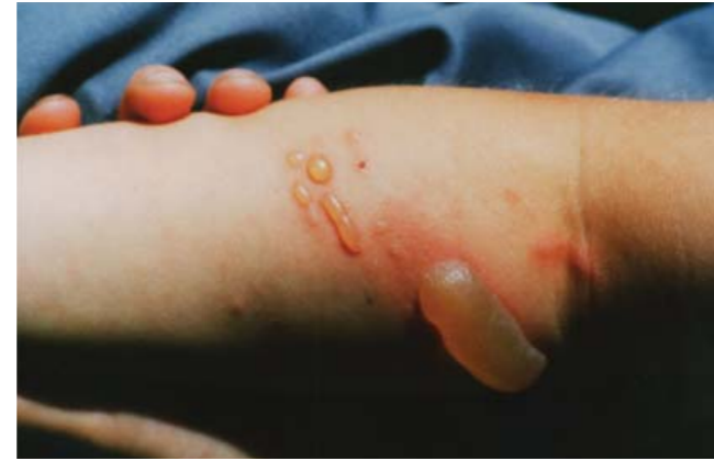
Hautverbrennung nach Saftkontakt und Lichteinwirkung

Die Pflanzen- und Tierwelt kann ebenfalls beeinträchtigt werden. Durch das enorme und schnelle Wachstum und die stark schattenden Blätter verdrängt er heimische Pflanzen. Wo die Staude wächst, geht die lokale Vielfalt der heimischen Flora und der von ihr abhängigen Fauna zurück.