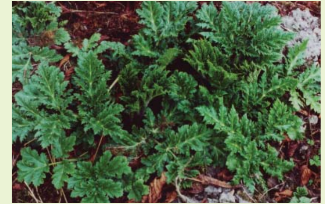
Riesen-Bärenklau im Rosettenstadium

Per Hand und Gerät: Direkten Hautkontakt sollte man meiden, indem man den Körper mit wasserabweisender Kleidung, Schutzbrille und Handschuhen schützt. Sollte dennoch die Haut mit dem Pflanzensaft in Kontakt kommen, muss die betroffene Stelle umgehend mit Wasser und Seife gewaschen werden.