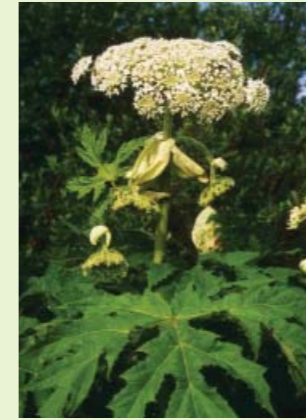
... Blätter und Blüten