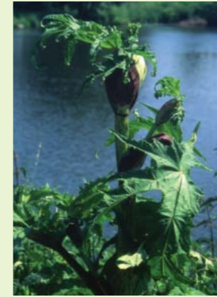
Stängel und Knospe ...